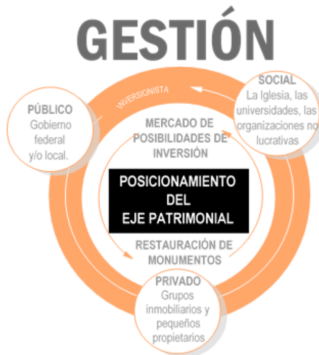
Figura 1. Esquema del ciclo de los involucrados en la renovación de un centro histórico. Se especifica el ciclo así:

Con este estudio de referente de Salvador de Bahía, a lo largo de años de trabajo se llegan entonces a ciertas conclusiones que deben ser consideradas para las futuras estrategias de la renovación de los centros históricos de la ciudad, representado gráficamente en la Figura 1 donde se muestra el esquema del ciclo de los involucrados.