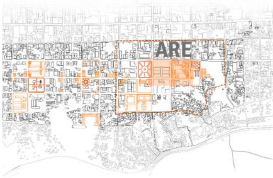
Figura 2. Centro histórico de la ciudad de Barquisimeto, Venezuela.

El primer paso para una intervención y revitalización de un sector de ciudad tan importante como es el centro hay que conocer sus variables, su historia y lo que actualmente se encuentra en el lugar para poder generar un plan de acción general para el sector. La Figura 2 muestra la ubicación del centro histórico de la ciudad de Barquisimeto, Venezuela.