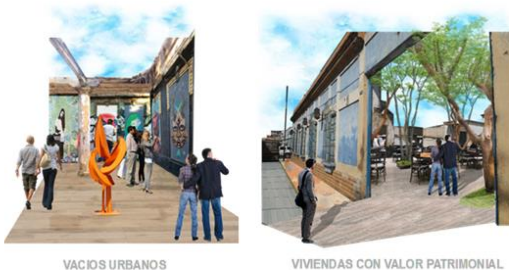
Figura 6. Propuesta de algunas viviendas del centro histórico de la ciudad de Barquisimeto.