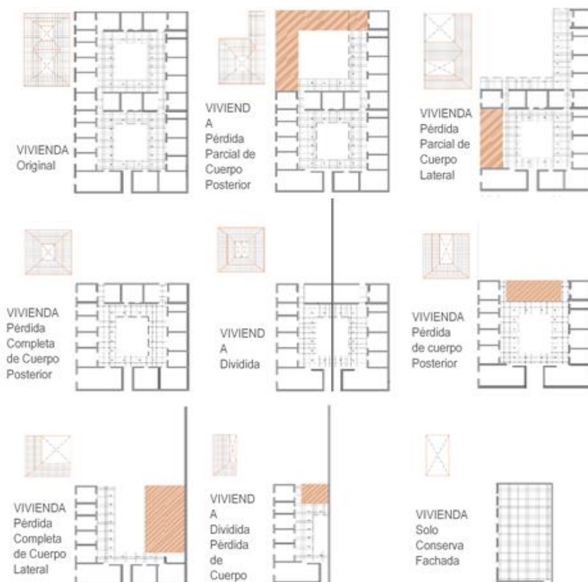
Figura 5. Oportunidades de para intervenir y potenciar el centro histórico de la ciudad de Barquisimeto.