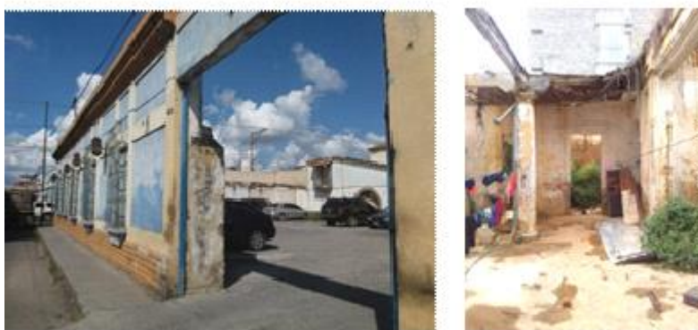
Figura 4. Estado de algunas viviendas del centro histórico de la ciudad de Barquisimeto. Por lo que se pueden apreciar un número reducido de viviendas con los patios intactos en su mayoría presentan pérdida de cuerpos, inclusive viviendas que han perdido toda su composición y se mantiene en pie únicamente la fachada, como muestra la Figura 5.

como vivienda o para ser un foco de atención que atraiga a la población. Se realiza un estudio de las viviendas de valor, que utilizaban patios centrales alrededor de los cuales se desarrollaba su dinámica. Este modelo se implementa desde la colonia y se continua haciendo posterior al terremoto de 1812 y en algunas viviendas que aún se han conservado [15]. Estas pasando a través de diferentes etapas siempre mantenido el patio, pero perdiendo cuerpos en su proceso de deterioro por falta de mantenimiento (ver Figura 4).