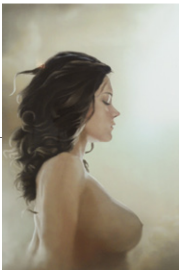
Rafael Yépez Una mujer entre las nubes Figura digital 40x30 cm 2015