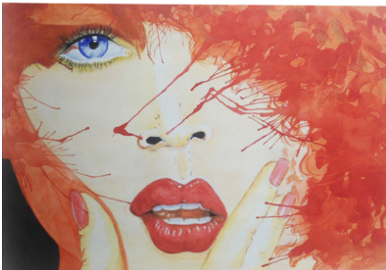
Evelyn Camero Rojo seducción Acrílico sobre cartulina 25x25 cm 2014