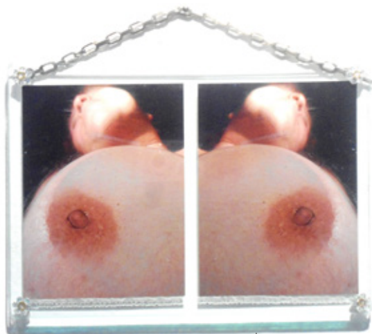
Giovanni Di Rosa La maja censurada Fotografía 32x38 cm 2015